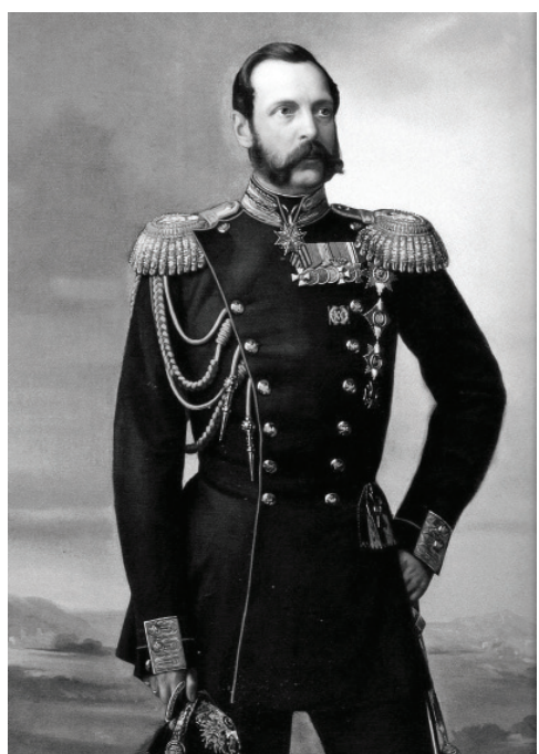
(на фото: Імператор Олександр II)

24 липня 1867 року Катеринославському губернатору Василю Дмитровичу Дуніну-Борковському довелося неабияк понервувати.